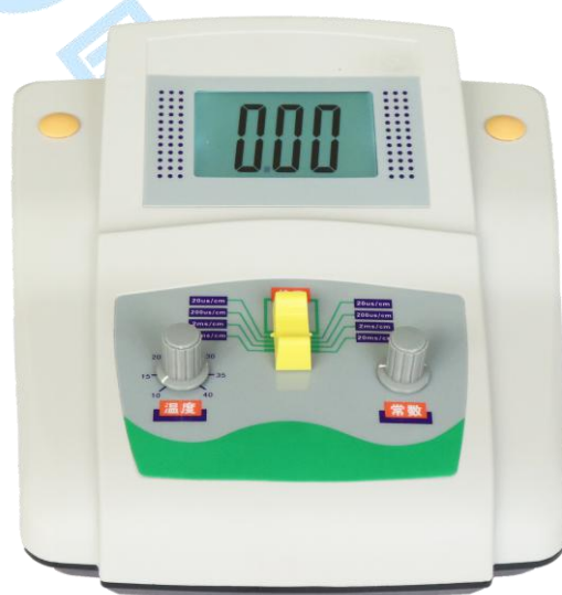
图 1 前面板示意图