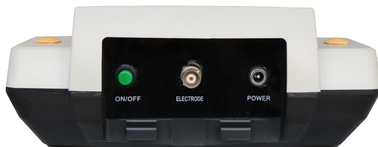
图 2 后面板示意图